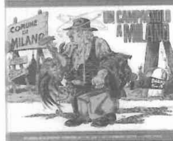
Jonny Logan

Torna Jonny Logan eroe tutto da ridere in formato ebook Per i buoni fumetti non esiste la stagione dell'oblio. Può darsi che debbano attraversare fasi di appannamento, oppure rovesci di carattere editoriale, ma un buon fumetto è sempre capace di catturare l'attenzione del lettore e sa trovare la strada per farsi apprezzare.